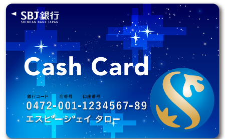
「普通預金プラス」キャッシュカード