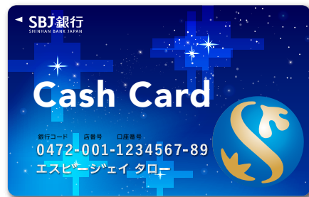
「普通預金プラス」キャッシュカード